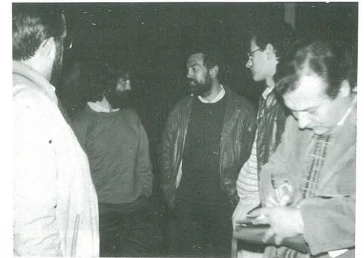
Després del col·loqui

"A l'hora de plantejar l'expedició s'ha de plantejar el fet d'anar o no amb sherpes. Nosaltres ho vam plantejar així perquè l'època que anàvem era molt dura..."