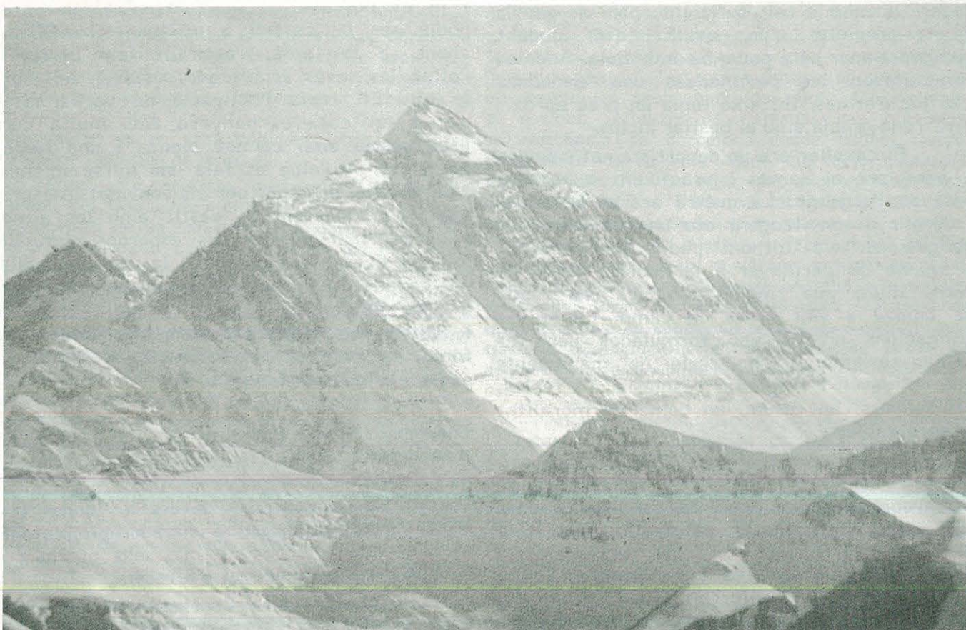
¡HEM FET EL CIM!