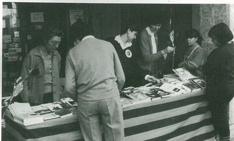
DIADA DE SANT JORDI

A continuació publiquem el primer premi d'aquesta categoria, de l'any 1971, amb el tema de "El fuego".