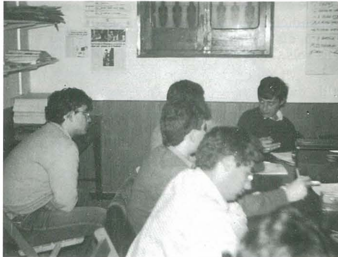
Xerrades de supervivència a la muntanya

Formas de tratar picaduras, desde los simples insectos a animales que encierran cierta peligrosidad, como el escorpión o la víbora, quemaduras, roturas y un sinfín de otras materias y trucos entre los que podemos encontrar, el destilador y el purificador de agua o bien el antibiótico contenido en ciertas partes de la cebolla. Todos ellos serán tratados poco a poco en esta publicación.